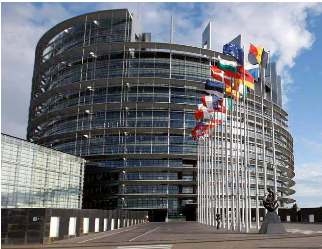
Palais Justus Lipsius