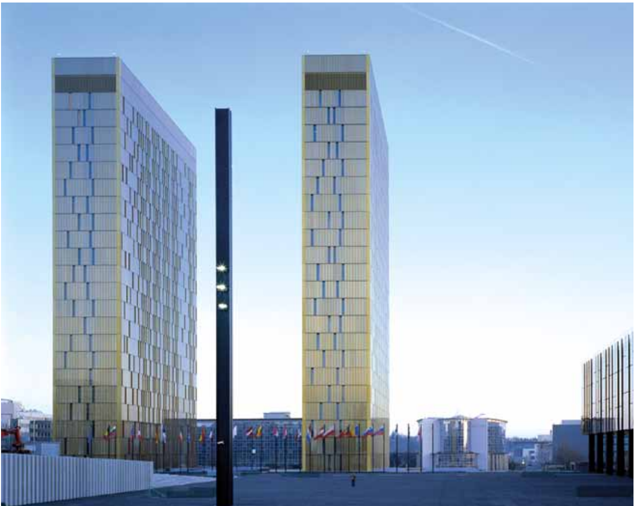
Cour de Justice